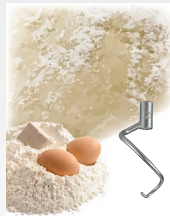
Knethaken, Edelstahl 15 00 205*

*Spritzschutz aus Kunststoff und Zugabeschale ohne Abbildung *Im Lieferumfang enthalten