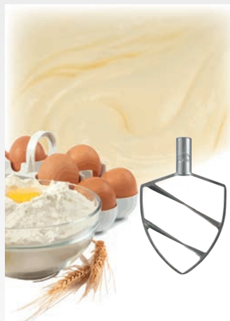
Rührer, Edelstahl 15 00 227*