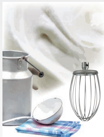
Schlagbesen, Edelstahl mit Ø 2,5 mm Drähten 15 00 228*