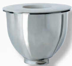
5 l Rührkessel, Edelstahl mit weißem Kunststoffdeckel 15 00 206*